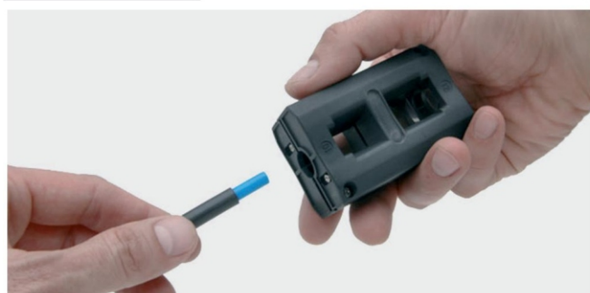
outil dénudeur de gaine pour tube polyamide gainé séries PG-PR