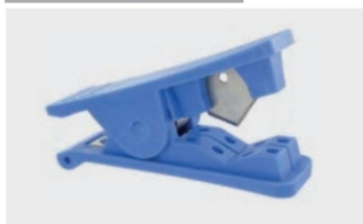
pince coupe tube