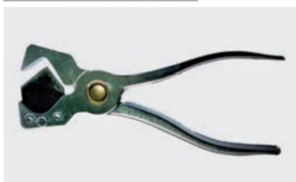
pince coupe tube métallique