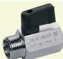
barre hexagonale chromée