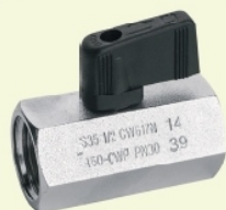
barre hexagonale chromée